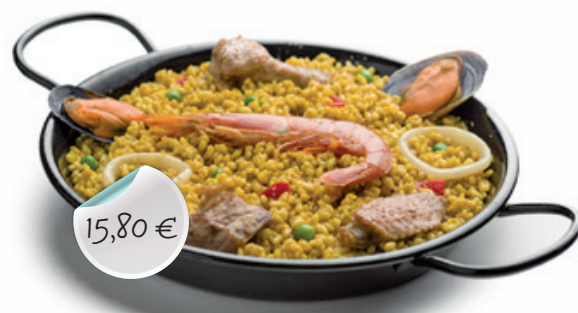
PAELLA AUX FRUITS DE MER Fruits de mer decortiqués, calamar, crevettes, moules, poivron, petits pois